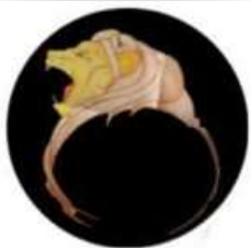
I LEONI RUGGENTI

I benefici che emergono quando partecipiamo sono : imparare, crescere, fare amicizia, cambiare le cose e riconoscere le opinioni altrui.